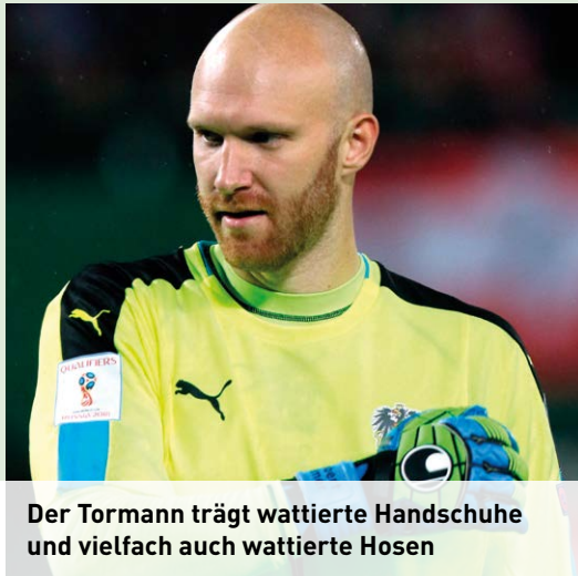
Der Tormann trägt wattierte Handschuhe und vielfach auch wattierte Hosen

Der Ball ist regelgerecht, wenn er kugelförmig, aus Leder oder einem anderen geeigneten Material gefertigt ist, einen Umfang von mindestens 68 und höchstens 70 cm hat, zu Spielbeginn mindestens 410 und höchstens 450 Gramm wiegt und sein Druck 0,6–1,1 Atmosphären beträgt, was 600–1.100 g/cm 2 auf Meereshöhe entspricht.