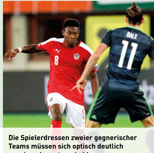
Die Spielerdressen zweier gegnerischer Teams müssen sich optisch deutlich voneinander unterscheiden